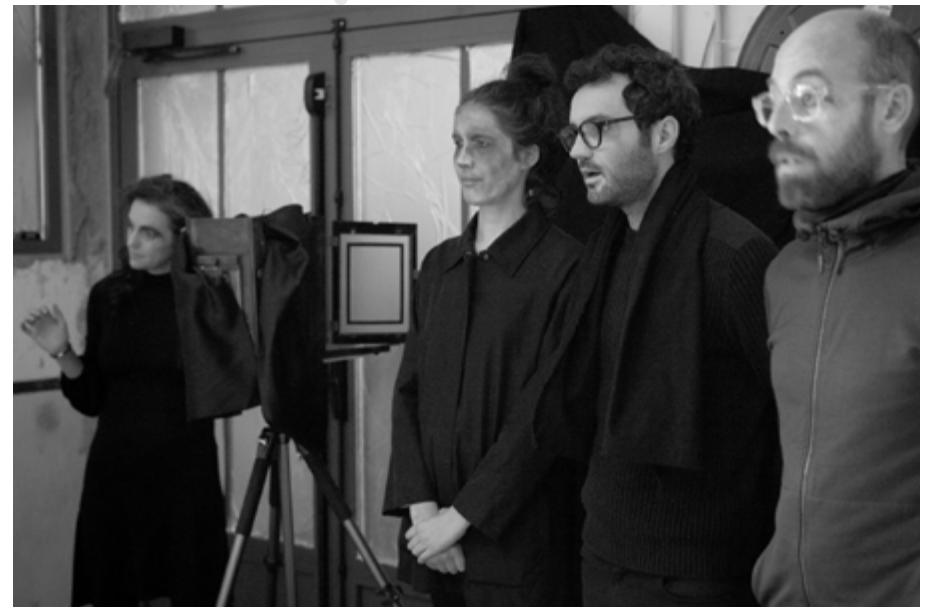
Le 3eme Œil, La Vilaine Frayeur, Rennes, 2019