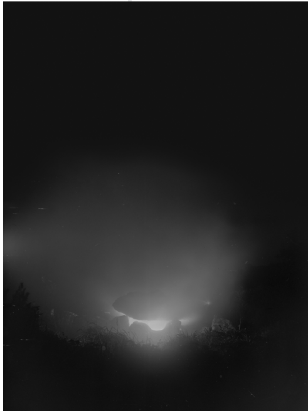
La bouche d'ombre, 2024, photographies à la chambre 18x24, pyrotechnie, tirage fineart mat 100x133 cm, cadre chêne