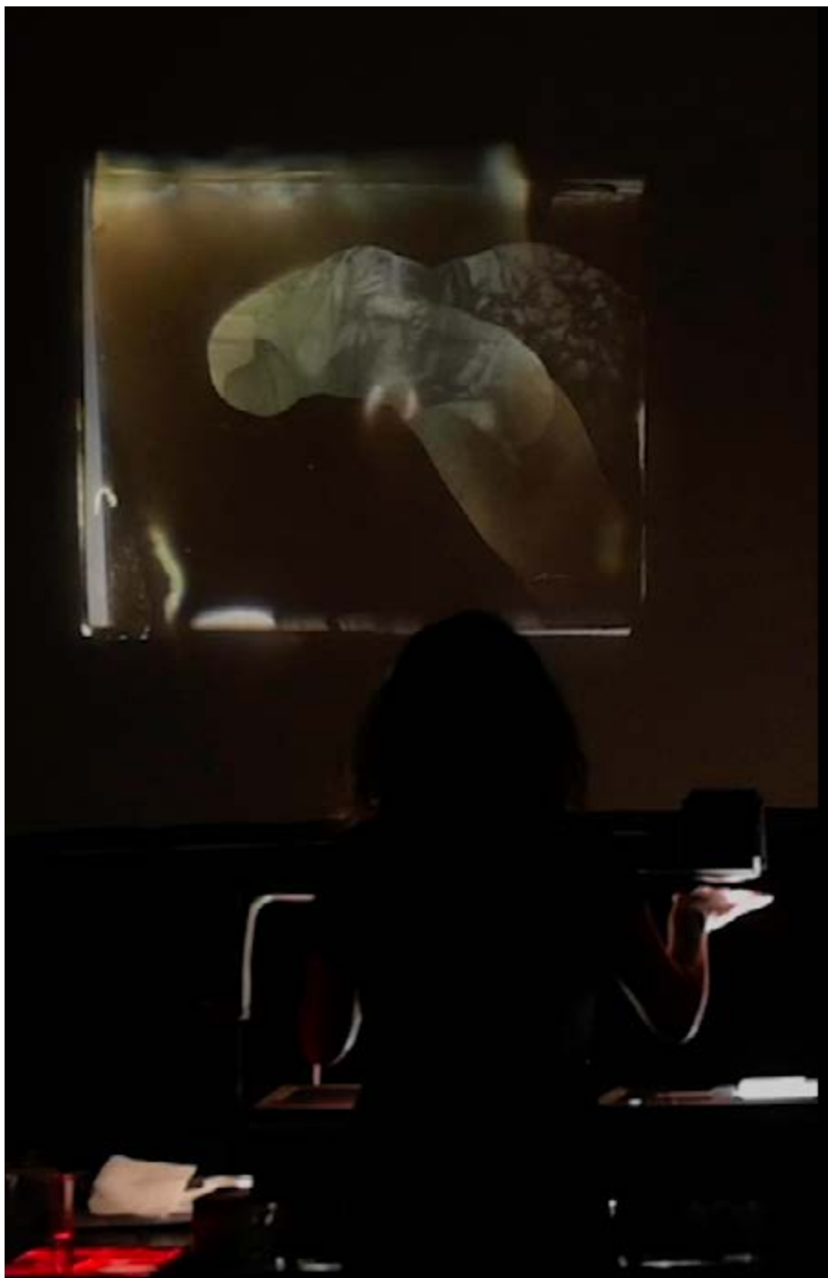
Naïa, résidence et performance au Winnipeg Film Group, Winnipeg, 2023