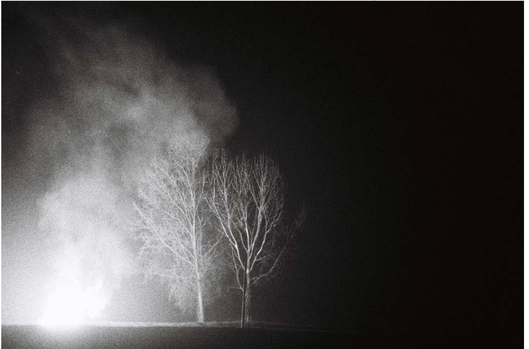
Nul mouvement de terrain n'indique la campagne habitée, tirage fine art mat, 70x100 cm, 2014