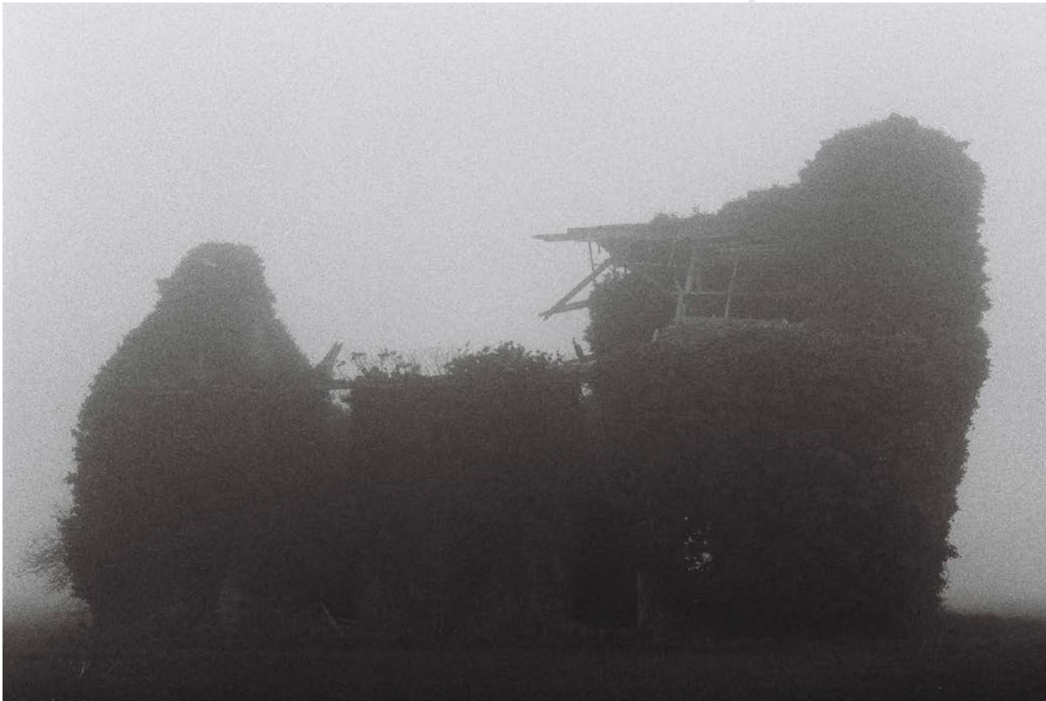
Nul mouvement de terrain n'indique la campagne habitée, tirage fine art mat, 70x100 cm, 2014