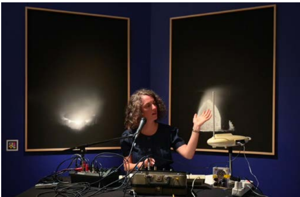
en haut vue d'exposition, Les Ateliers du Vent, Rennes, mai 2024 en bas, performance à la Greenhouse gallery, Guernesey