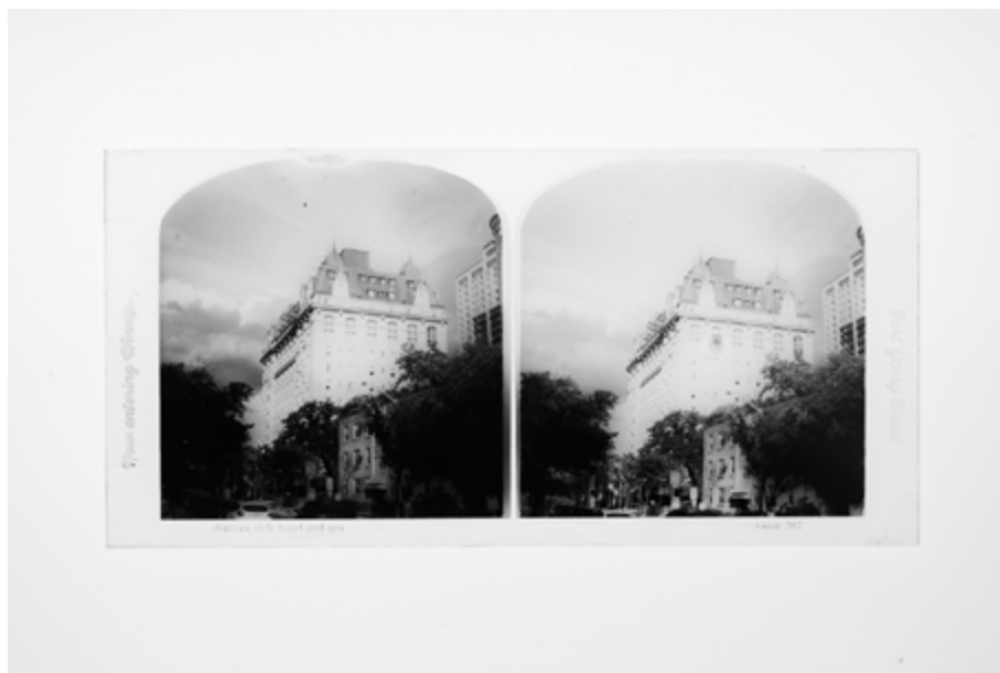
Now entering Winnipeg, dans le cadre de l'exposition The Undead Archives , 1CO3 Gallery, Winnipeg, 2023