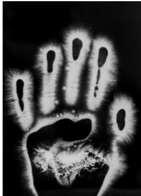
en haut, laboratoire prise de vue et développement de la performance sur papier argentique en bas, détail des éclairs générés par l'holoélectron sur le papier, et épreuve d'une main