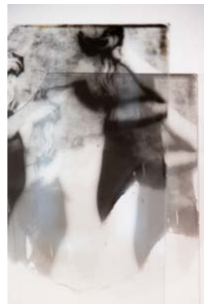
Série de photographies à la gélatine argentique tirée sur verres brisés, étagère en chêne brut, épingles, exposition l'Âtre et le Néon, Galerie Albert Bourgeois, Fougères , 2021