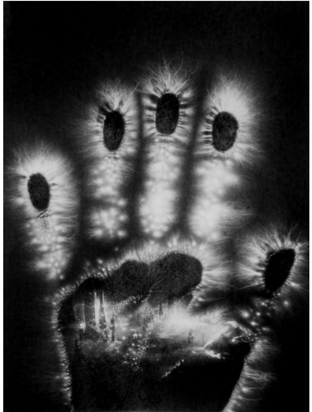
épreuve d'une main réalisée lors du Marché Noir à Rennes