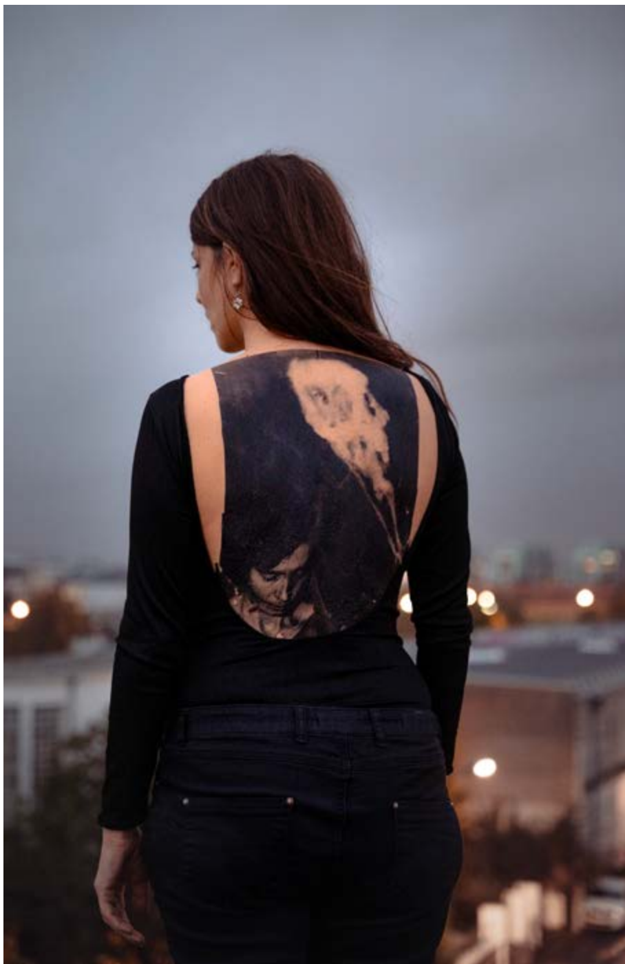
Surfaces sensibles, photo numérique, tirage fineart 50x70, Rennes, 2022