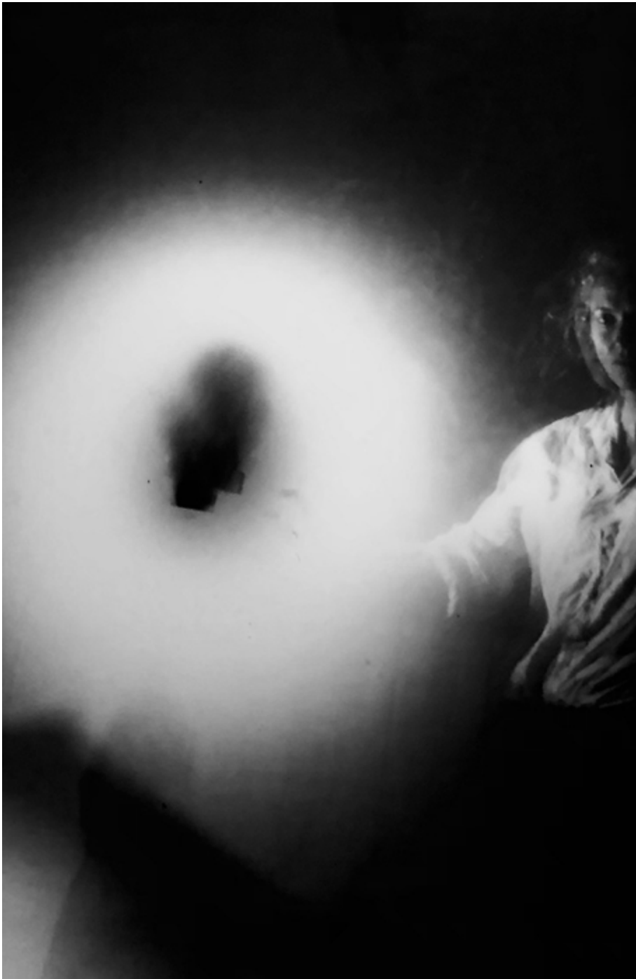
Autoportrait, selfire, 2022