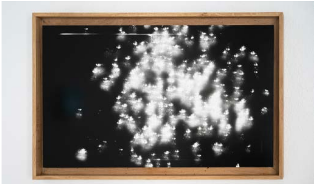
Mitraille, Harman positif paper, plombs, cadre chêne, 60x100cm, 2022