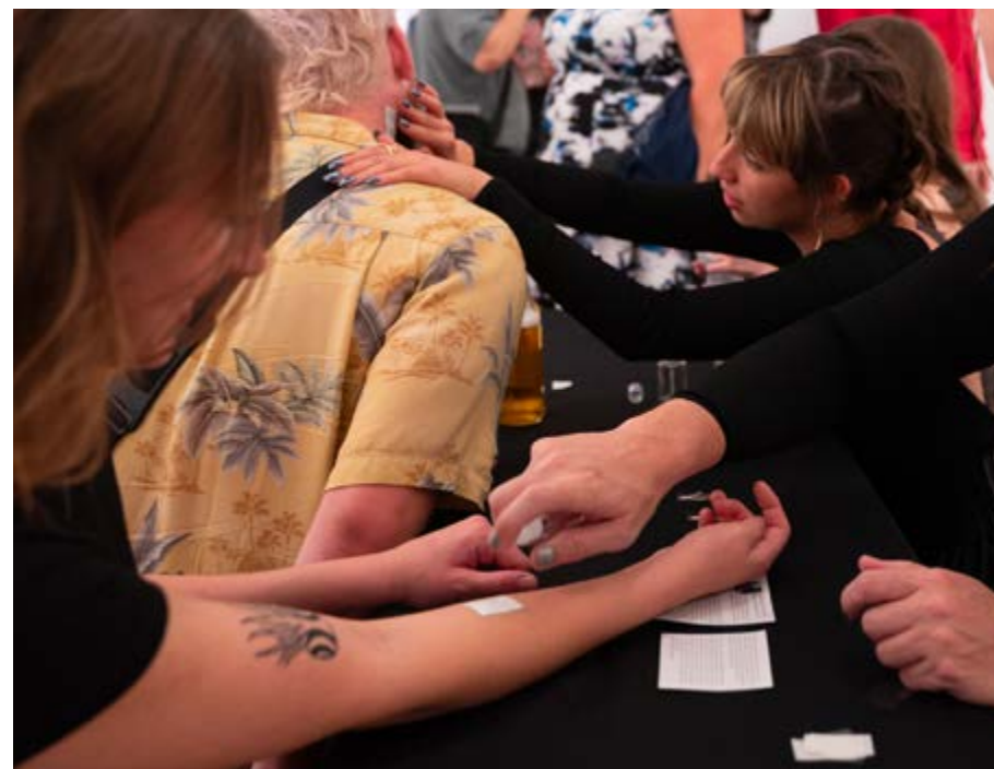
Surfaces sensibles, performance dans le cadre de l'exposition The Undead Archives , Winnipeg, 2023