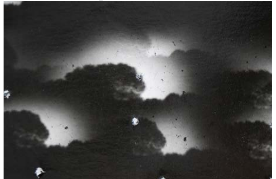
Mitraille, détail, Harman positif paper, plomb, 2022