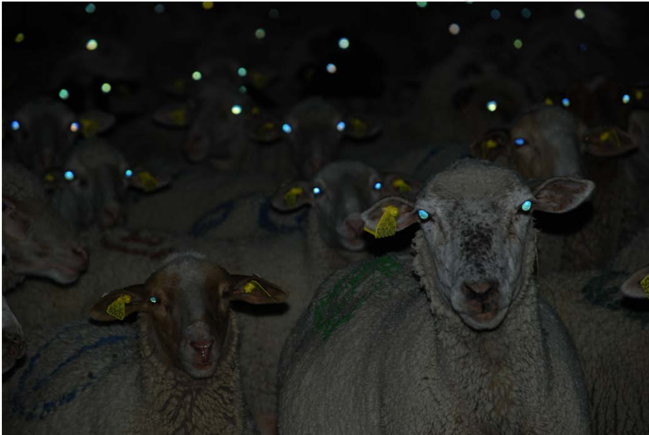
Phosphènes : (moutons) tirage hahnemühle mat bright white, contrecollé sur dibbon, 60x40cm, 2009