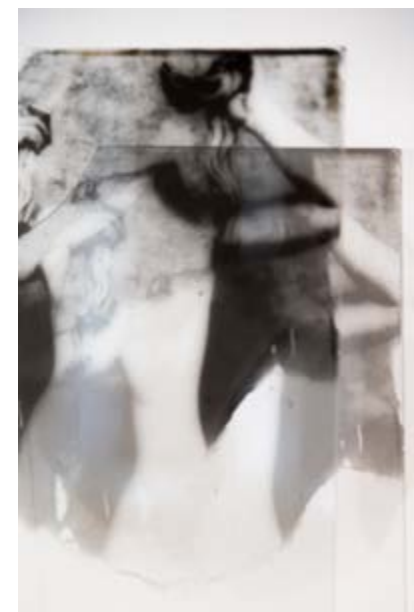
Série de photographies à la gélatine argentique tirée sur verres brisés, étagère en chêne brut, épingles, exposition l'Âtre et le Néon, Galerie Albert Bourgeois, Fougères , 2021