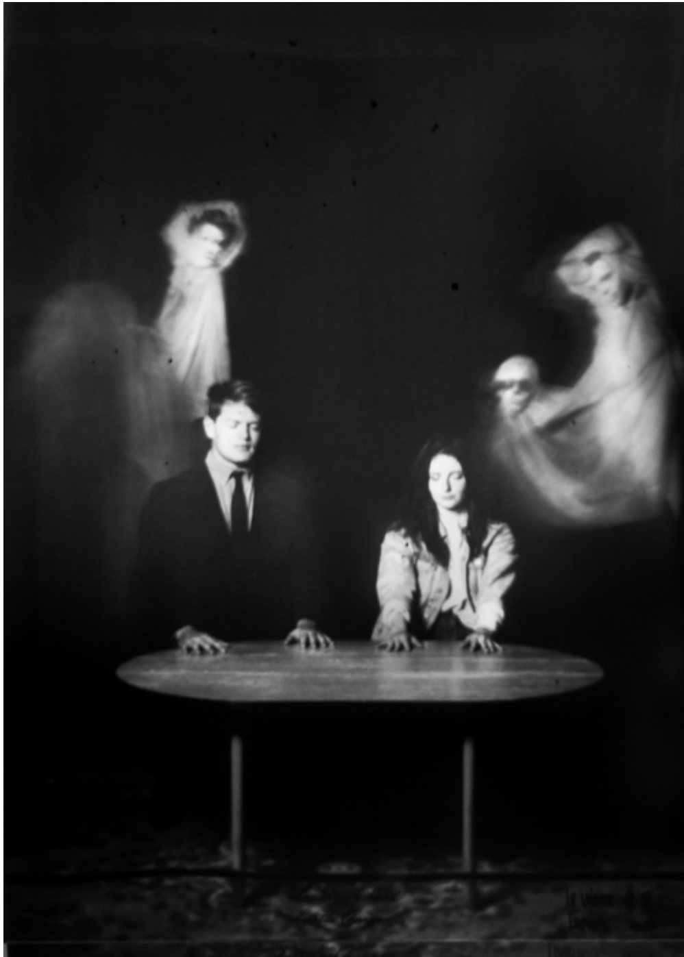
Le 3eme Œil, La Vilaine Frayeur, Rennes, 2019