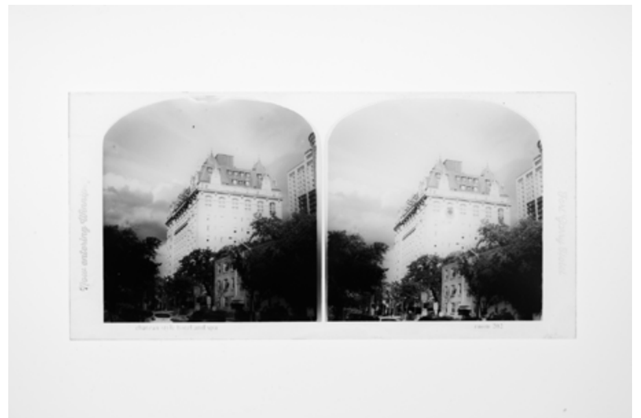
Now entering Winnipeg, dans le cadre de l'exposition The Undead Archives , 1CO3 Gallery, Winnipeg, 2023