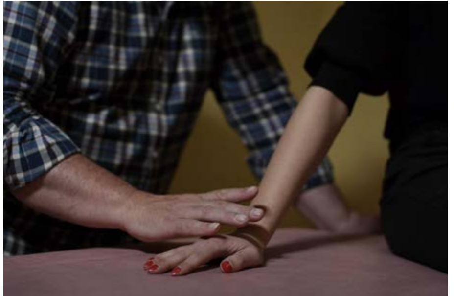
images extraites de la vidéo Passer, couper, barrer, lever, panser , 2021