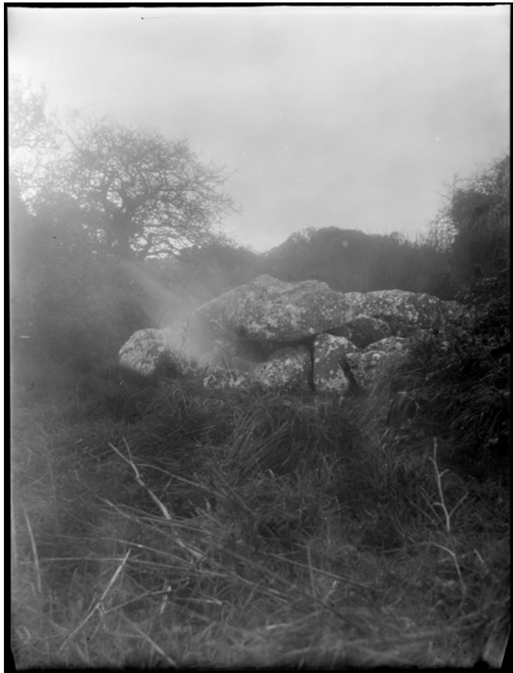
photographies à la chambre 18x24, noir et blanc, tirage fineart 112x150 cm, Jersey, 2023