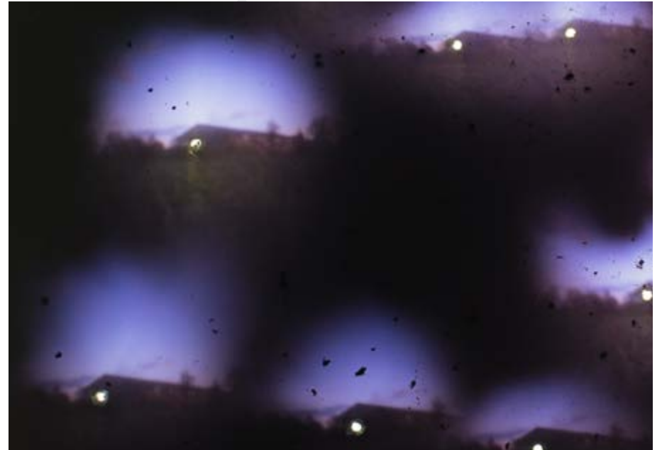
mitraille (couleur) détail, 6 plan film Velvia 50, 8x10 inches, 40x75cm, table lumineuse, 2018